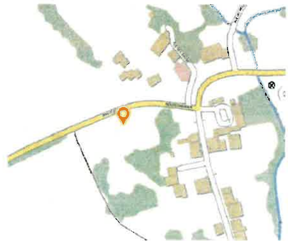
Zone d'aléa moyen de mouvement de terrain

Modification : Augmentation de la longueur de la baie vitrée SUD et augmentation de la surface de plancher